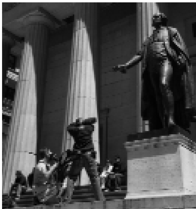
NEW YORK. STATUE DE G. WASHINGTON. D. COMARÉ.